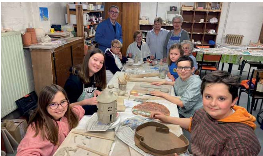
Le plaisir de modeler la terre et de créer ensemble