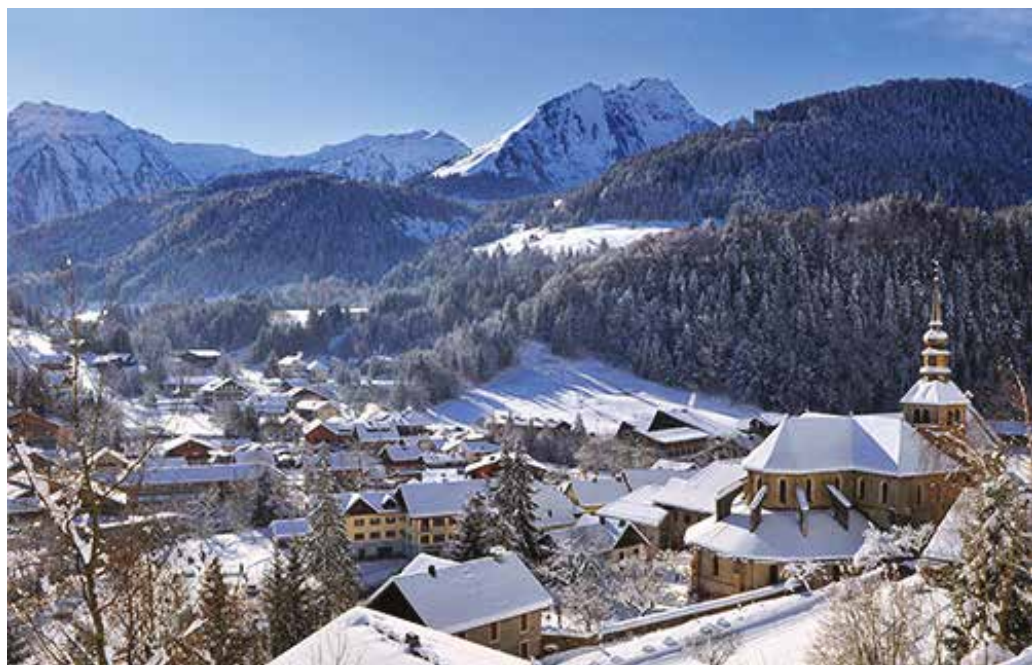
Destination classe de neige : La Chapelle d'Abondance